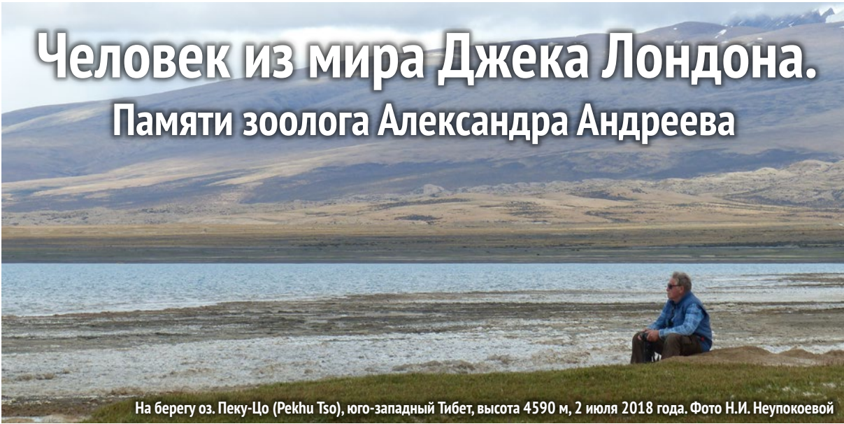
На берегу оз. Пеку-Цо (Peckhu Tso), юго-западный Тибет, высота 4590 м, 2 июля 2018 года.